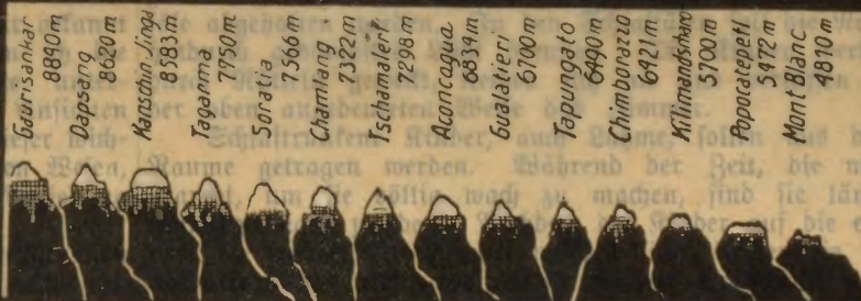
Vergleichende Darstellung der Gesamtsteighöhe der von uns gelieferten mech. Leitern mit den 14 höchsten Bergen d. Erde.