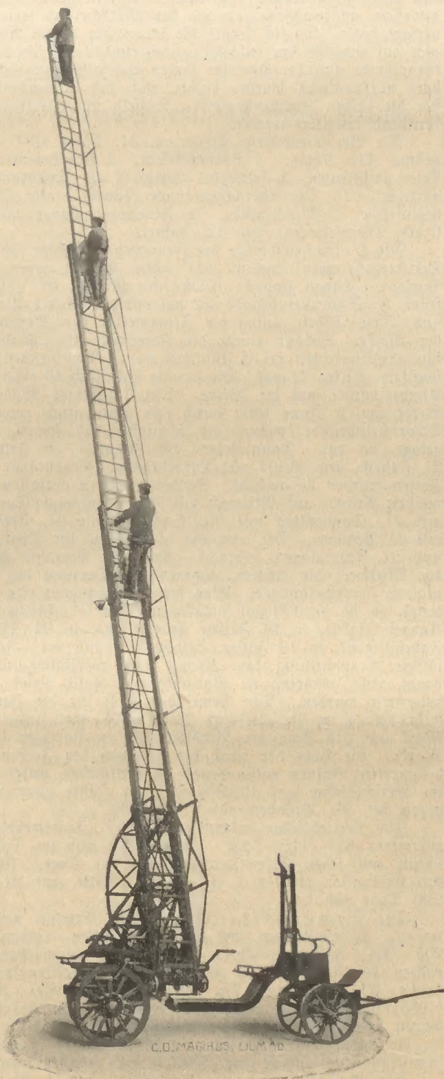
Magirus-Drehleiter Konstruktion D VI aufgerichtet, seitlich gedreht, ausgezogen und bestiegen.

diegene und zweckmäßige und dabei elegante Ausführung dieser Geräte, wie der aller anderen von den „Vereinigten“ ausgestellten Gegenstände anerkennend hervorgehoben sein. Das Lob, welches den ausgestellten Leiterkonstruktionen erteilt werden konnte, läßt sich mit gutem Gewissen auch auf die Spritzen übertragen. Die ausgestellten Exemplare, Fabrikat Flader und Braua, haben gezeigt, daß der Praktiker die modernen Errungenschaften der Technik zu oerwerten versteht. Der Ewald-Krankenwagen hat gegen die bisherige Ausführung schätzenswerte Vervollkommnungen, wie doppelte Federung und besondere Stützfüße zur Feststellung der Achse, aufzuweisen.