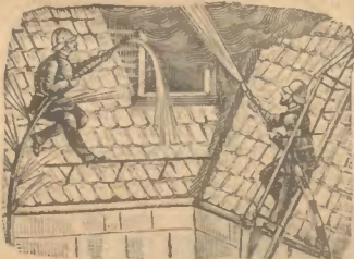
Ohne Zighn. Mit Zighn.